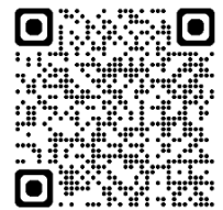
「授業づくりリーフレット2026」

2月13日（金）の「学校訪問事業オンライン説明会」への多くの皆様のご参加、ありがとうございました。当日都合がつかないとの連絡のあった所属には、説明会動画のアドレスを送付しております。「授業改善支援訪問」の2次締切は5月8日、「要請訪問」の申込開始は4月1日です。ぜひ、研修の一助としてご活用ください。