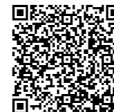
サービスホールの概要