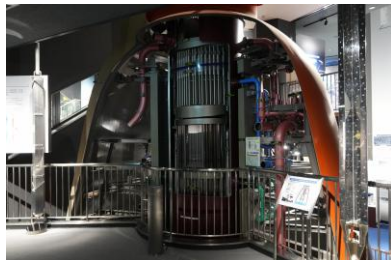
②柏崎刈羽原子力発電所サービスホール