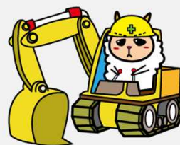
新潟県土木部 公式マスコットキャラクター 「こめゆきくん」