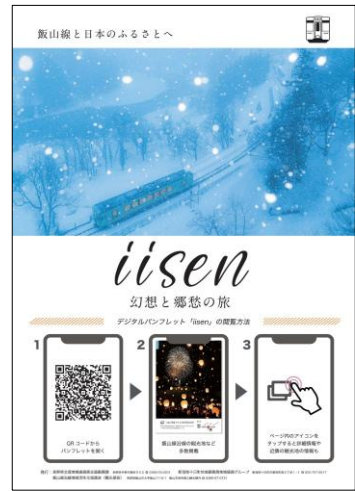
▲飯山線観光パンフレット

[発行: 新潟県十日町地域振興局(十日町市妻有町西2-1 ☎025-757-5517)]