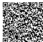
メンバー登録 フォーム

新潟県電子申請システム https://apply.e-tumo.jp/pref-niigata-u/offer/offerList_detail?tempSeq=17588