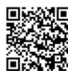
募集情報 ホームページ

新潟県ホームページ https://www.pref.niigata.lg.jp/sec/murakami_kikaku/event-volunteer2.html