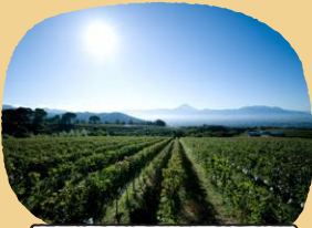
ぶどう畑からの眺望