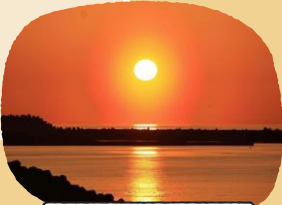
日本海に沈む夕日