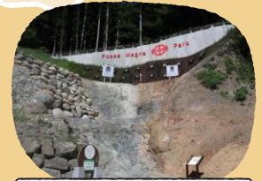
フォッサマグナパーク