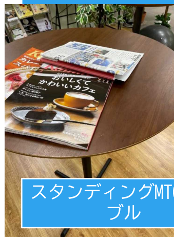
スタンディングMTGテーブル