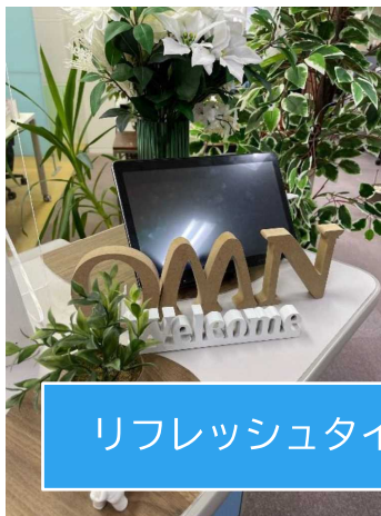
リフレッシュタイム