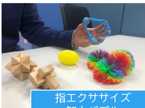
指エクササイズ 知力パズル