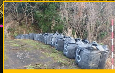
大型土のう設置完了(先行着手内容)