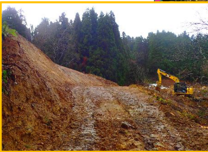
工事用道路整備状況(先行着手内容)