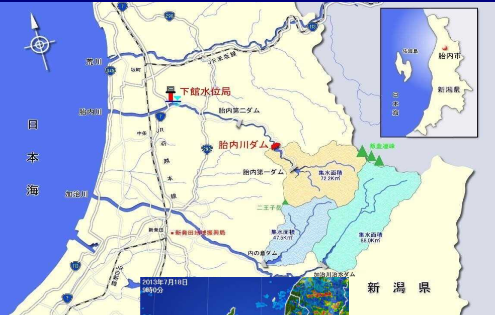
ダム周辺の 雨雲の状況

7月17日の昼過ぎから降り出した雨は18日の昼過ぎまで断続的に降り続き、胎内川ダムで24時間累計雨量が79mmとなりました。この為、胎内川ダムでは洪水となり放流量を抑えて洪水調節を行い、ダム下流の河川に流れる水量を軽減するようにダム操作を行いました。 それにより、下流の下館水位局付近では、洪水調節により最高(ピーク)水位を53cm下げる効果がありました。