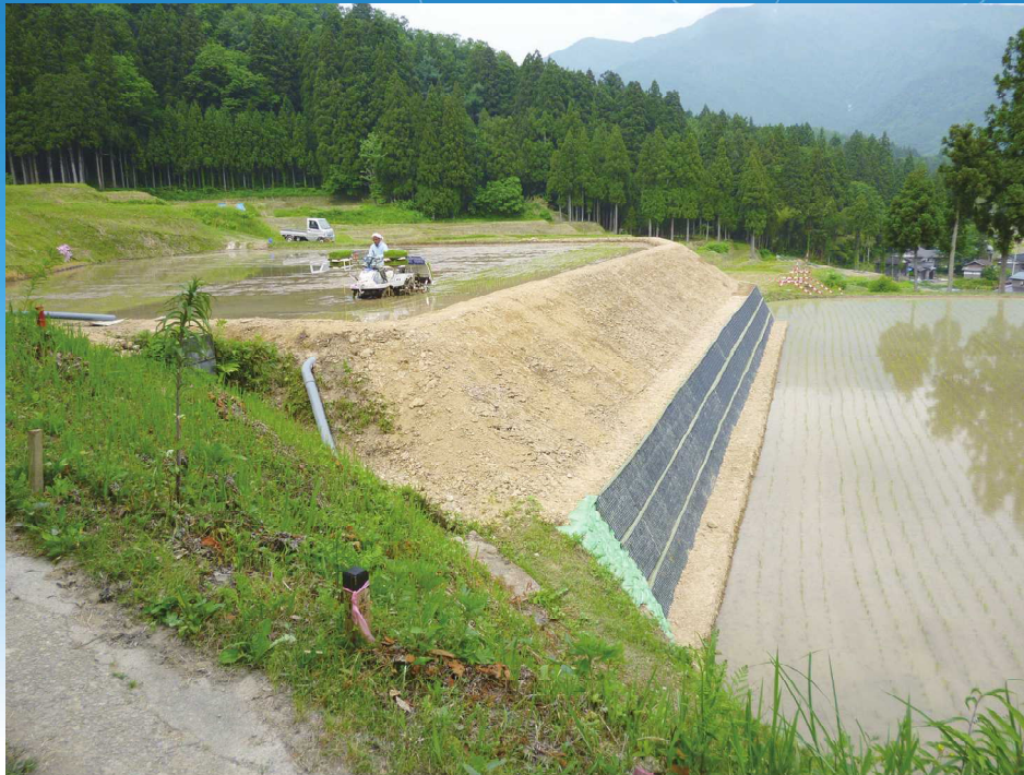
災害復旧工事が完了した北五百川の棚田（H24年6月撮影）