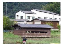
野鳥観察小屋のイメージ