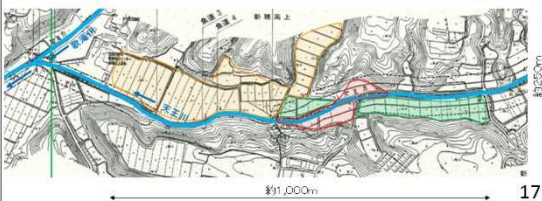
協議会の目的・取組内容(案)