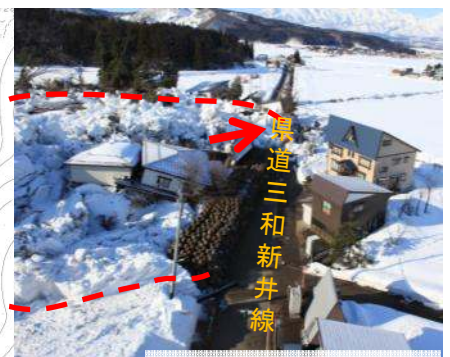
①末端部人家被災状況 (3月14日8時撮影)