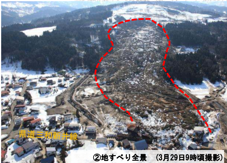
②地すべり全景 (3月29日9時頃撮影)