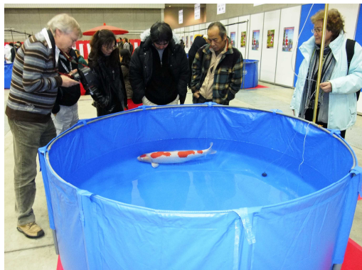
品評会に訪れる海外の愛好家

また、平成32年(2020年)には「東京オリンピック・パラリンピック」が開催され、新潟県を全世界にアピールする絶好の機会である。世界各