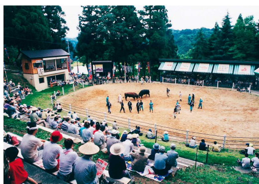
錦鯉と同様に地域の独自文化の象徴「闘牛」(小千谷市小栗山)