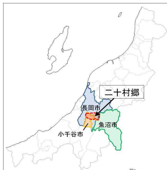
錦鯉の発祥の地「二十村郷」

錦鯉の発祥の地は、新潟県の中越地方、 こしぐんにじゅうむらごう 古志郡二十村郷（現在の長岡市、小千谷市、魚沼市の一部）であり、江戸時代後期に食用として飼育していた真鯉が突然変異したものが錦鯉の起源とされている。最も早く誕生した品種は、白地に赤の斑紋を有する「紅白」とされている。その後の品種改良により、現在では約 100 種類に分けられている。