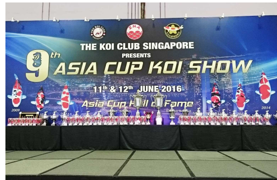
海外でも開催される錦鯉品評会

このように錦鯉の魅力である品種の豊富さ、新潟県の錦鯉の生産体制や品質の高さ、さらに「発祥の地」としてのブランド力などから考えて、新潟県の錦鯉養殖は、更なる発展が見込まれる産業であるといえる。