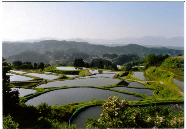
錦鯉の故郷（野池）風景

新潟の錦鯉の美しさは、中越地区山間部の厳しくも明瞭な四季によって育まれた。その美しさが、日本のみならず多くの海外の国からも愛好される大きな理由である。