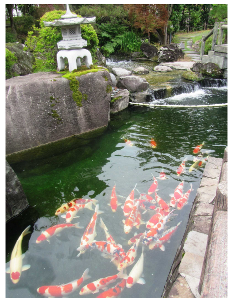
小千谷市錦鯉の里

優美に泳ぐ錦鯉の群れは、見る人を魅了する。新潟県では、錦鯉の観賞ができ、歴史を学べる施設として「小千谷市錦鯉の里」がある。また新潟市や長岡市などの交流拠点施設や水族館でも錦鯉を観賞することができる。さらに、秋には、錦鯉の品質や飼育技術を競う品評会が県内各地で開催され、錦鯉を間近に楽しむことができる。海外から県産錦鯉を求める数多くの流通業者や愛好家が県内生産地を訪れ、各地で交流が盛んに行われている。日本の伝統美が注目される中、新潟の風土によって守り育てられた華麗な錦鯉を発祥地で観賞できることは、観光や文化交流の拡大に貢献するであろう。