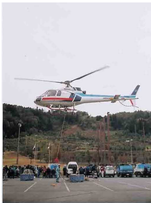
被災地から錦鯉を救出する生産者

平成16年(2004年)10月16日に新潟県中越地区を襲った最大震度7の中越大震災は、錦鯉の主産地である山間地を中心に甚大な被害を与え、錦鯉関連施設等も壊滅的な打撃を受けた。あまりの被害の大きさに、地震直後は、新潟の錦鯉文化の存続が危ぶまれたが、若い生産者達が地震直後から立ち上がり、倒壊した家屋下から代々受け継いだ親鯉を救出するなど、復興に向けて動き始めた。平成19年(2007年)7月の新潟県中越沖地震で再び被害を受けたが、中越大震災から10年経過した平成28年には生産金額は震災前を超えるまでになり、年に一度の生産者の晴れの舞台である新潟県錦鯉品評会への出品数も震災前と同じレベルまでに回復した。未曾有の震災から力強く元の姿へ立ち戻った錦鯉文化や産業は、新潟県における震災復興のシンボルとして強く印象づけられている。