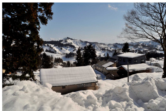
雪に閉ざされる山間部(長岡市山古志)

錦鯉は、真鯉が突然変異して生まれた。錦鯉発祥地には、かつて自宅の床下で冬期間のタンパク源として食用の真鯉を飼育する風習があったが、それは豪雪に閉ざされる山間部において冬期間を乗り切るために考案された知恵の一つである。こうした食文化的な背景のもとに、錦鯉が生まれた。錦鯉以外にも同地域には国の重要無形民俗文化財に指定されている「牛の角突き(闘牛)」などの独自文化が発展してきており、それもまた錦鯉と深い関係をもっている。こうした文化的背景が評価され、この地域における「雪の恵みを活かした稲作・養鯉システム」が、FAO(国際連合食糧農業機関)の世界農業遺産の候補及び日本農業遺産登録に係る一次審査を通過した(平成29年(2017年)1月末時点)。