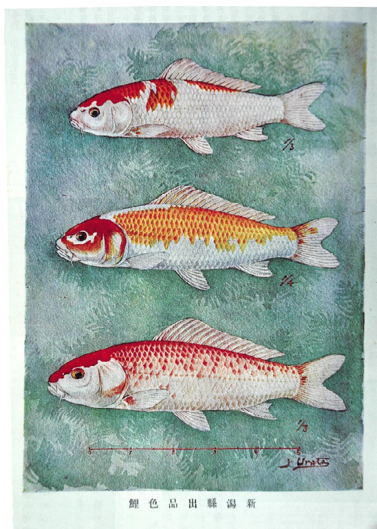
大正博覧会に出品された新潟県産錦鯉の一部

錦鯉が世間で広く認知されるようになったのは、大正3年（1914年）に開催された「東京大正博覧会」に新潟県から錦鯉が出品されたことが発端とされている。以降、昭和40年代に国内で錦鯉ブームを迎え、現在は海外において錦鯉の人气が沸騰している。