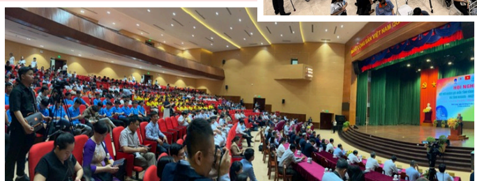
過去にビンロン省にて人材マッチングイベントを開催した際の様子 (R6年8月)