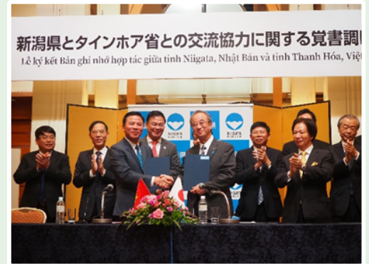
タインホア省との調印式

両省の若い人材が県内企業に就職し、キャリアを積むことで、県省の長期的な発展に寄与することを期待しています