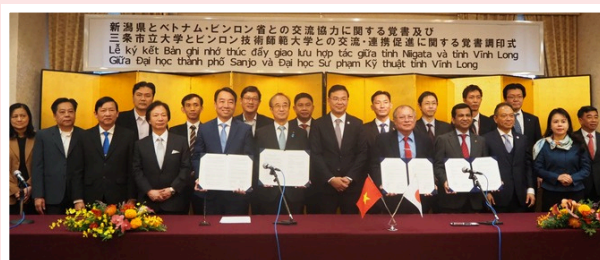
ビンロン省との調印式