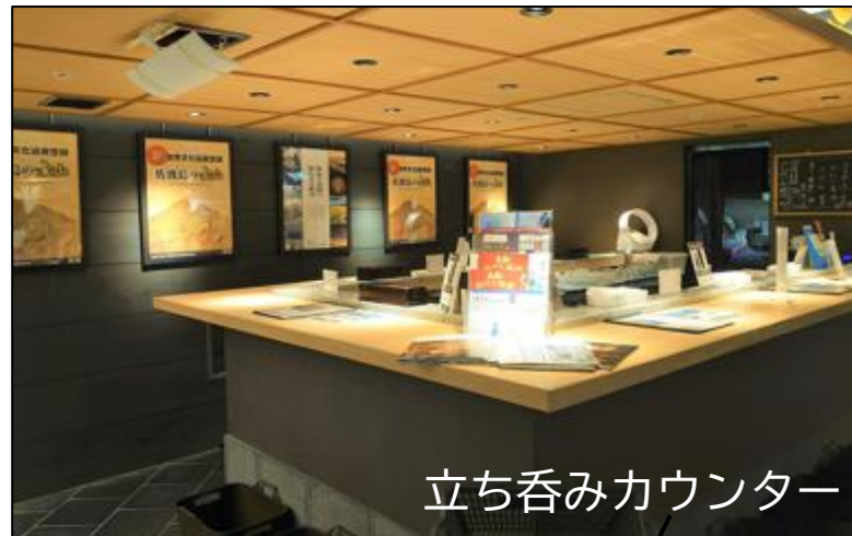
立ち呑みカウンター