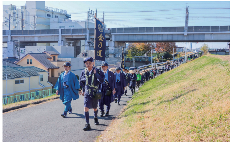
蕨ウォークイベント