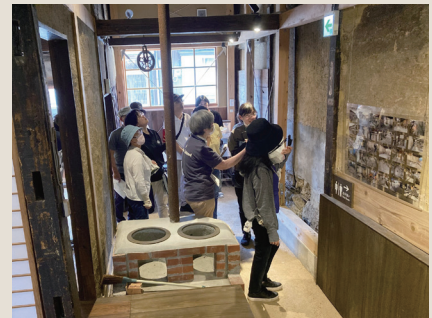
ガイド向け研修会の様子

今年度は、関係者との意見交換会や、相川ふれあいガイド向け研修等を実施し今後は、公開町家に加え、来訪者と地域住民等との交流の場としての機能の拡充を図っていきます。