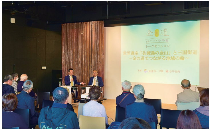
小千谷交流イベント

引き続き、文化と歴史をつなぐ「金の道」を核に、沿線自治体が一体となった情報発信と交流促進を図ってまいります。