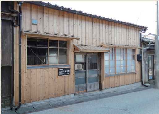
旧深見家住宅外観

旧深見家住宅は、相川中京町の中ほどに位置し、出の短い庇と板張りの外観、表から裏へ延びる通り土間とそれに沿って居室や座敷が並び、お間取りとなっており、相川地域の特徴的な町家です。