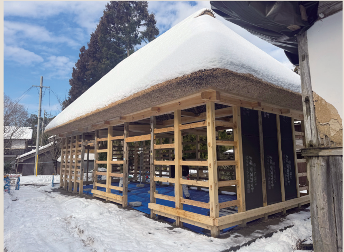
修理が進む牛納屋の様子

来年度は、土壁や内装等の工事を行う予定です。2027年以降も順次、納屋・土蔵・便所等の修理工事を行い、2032年に全ての建物の修理が完了する計画です。