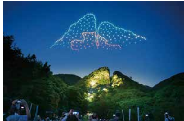
ドローンショーの様子