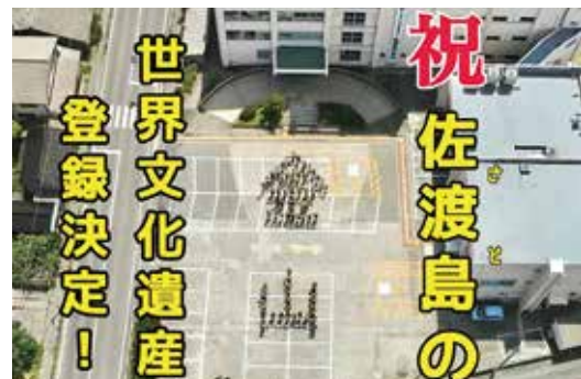
佐渡地域振興局相川庁舎人文字