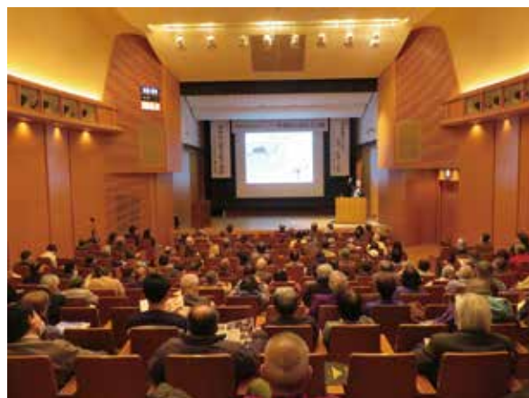
フォーラムの様子