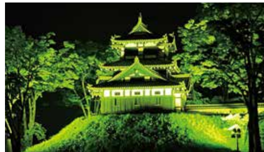
上越市：高田城三重櫓