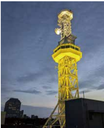
新潟市：TeNY テレビ新潟

また、同年7月31日（水）、新潟県佐渡地域振興局相川庁舎では職員による「金山」の巨大人文字を作り、登録を祝うとともに、島内外から応援いただいた多くの皆様への感謝を表現した。