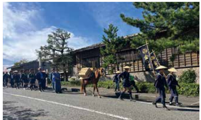
御金荷の道ウォークイベント