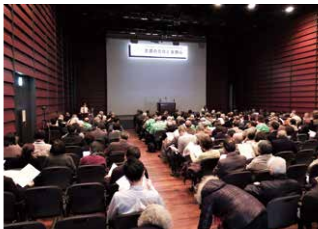
登録推進講演会 / 時事通信ホール（2020年）