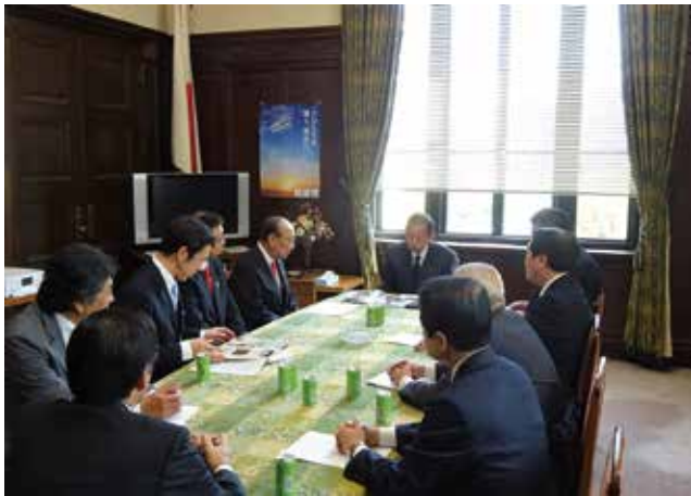
自由民主党（幹事長）への要望（2017年）

登録実現を目指し、ポイントとなる各段階で県民会議のメンバー等による国関係機関（内閣官房・外務省・文部科学省・文化庁）への要望を実施したほか、各地域の新潟県人会や各種企業・団体、県出身関係者などへ登録実現に向けた協力・支援要請を適宜実施した。