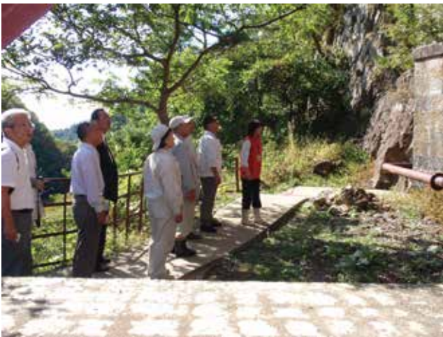
現地学習会の実施

「佐渡島の金山」の世界文化遺産登録を受け、2025（令和7）年2月定例会において、設立準備会を立ち上げ、2025（令和7）年4月1日から『佐渡市「佐渡島の金山」世界文化遺産を応援する議員連盟』として改組再始動することを決定した。