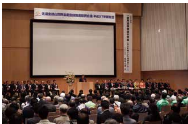
第1回総会（平成27年度）の開催