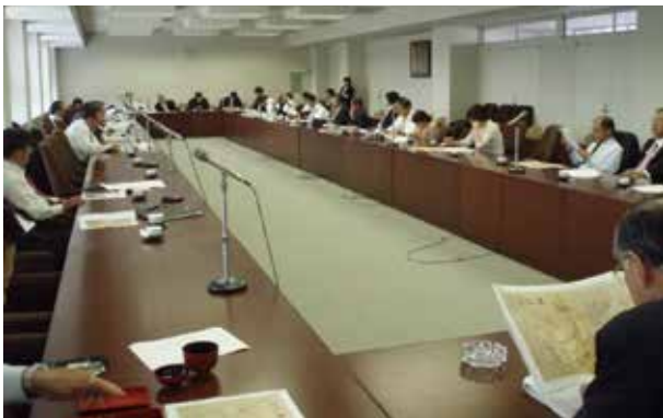
定例会（勉強会）の開催