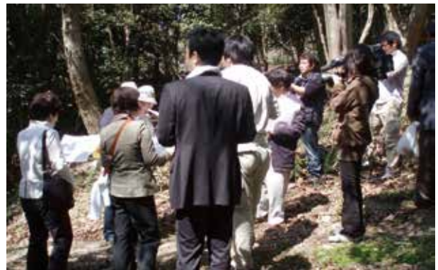
現地視察（佐渡金銀山）の実施