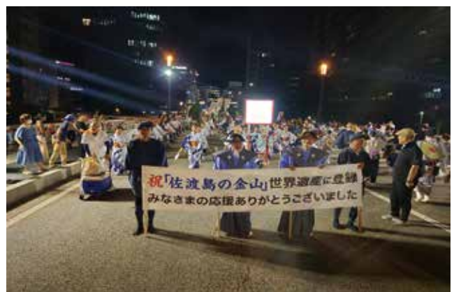
新潟まつりでのPR活動