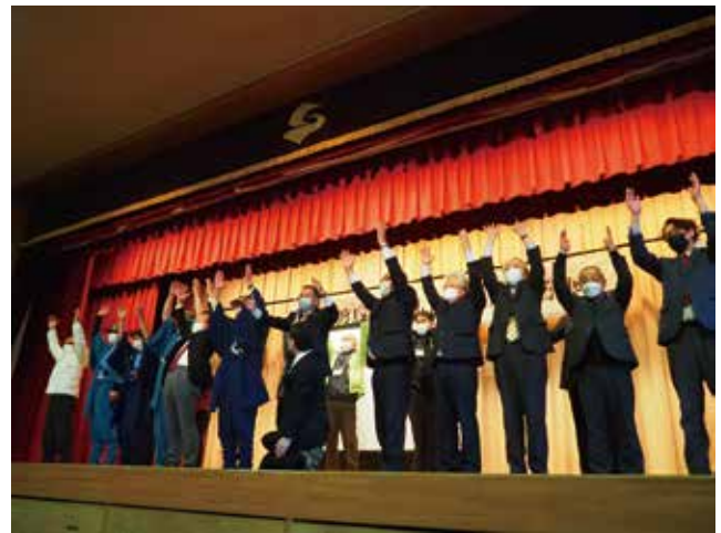
国内推薦決定イベントへの参加