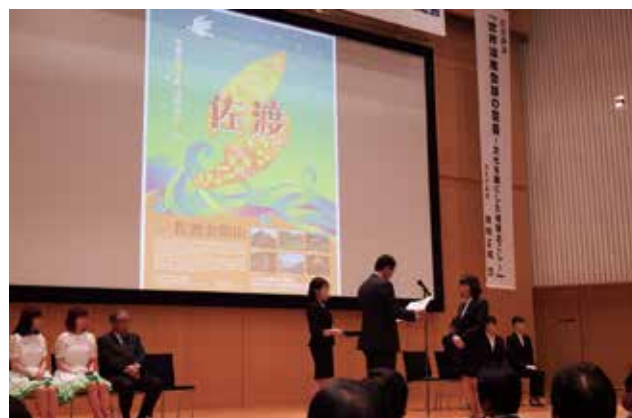
ポスターコンクール表彰式