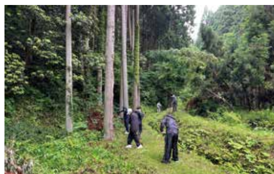
環境整備作業（草刈り）