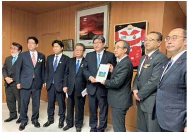
文部科学大臣への要望（2021年）