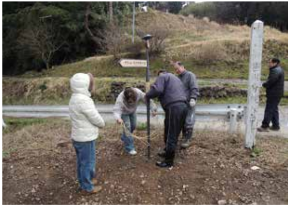
集落案内サインの設置

今後も、笹川集落が世界的な価値を認められたことを誇りに、この美しい砂金山由来の農山村景観を守り、地域住民の手によって未来へと引き継ぐため、地域の価値を高める取組を継続することとしている。