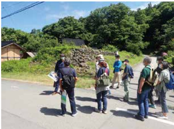
現地見学会のガイド