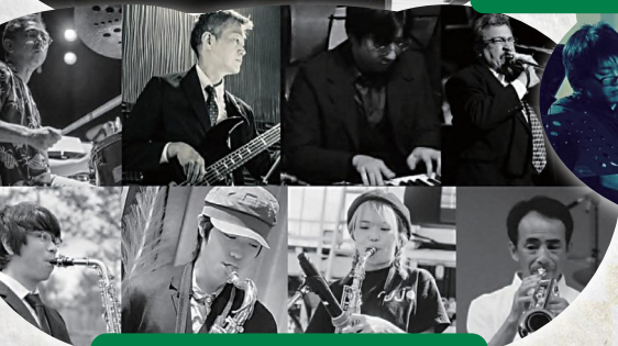
The Swingin' Eight