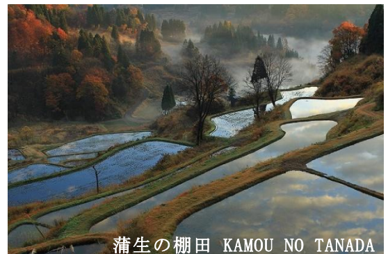
蒲生の棚田 KAMOU NO TANADA