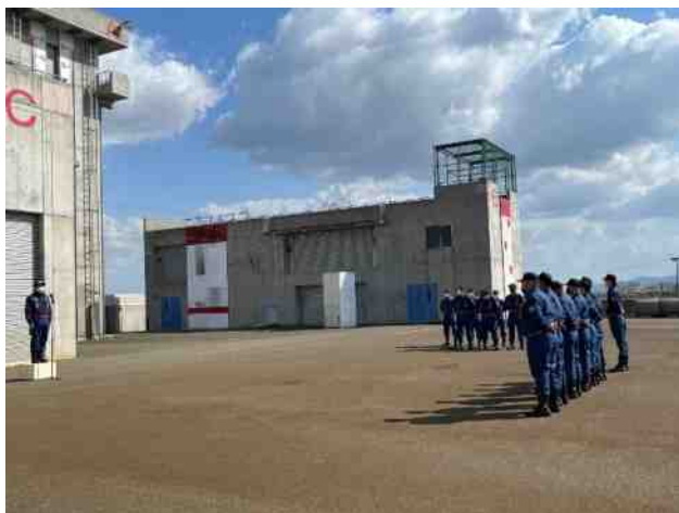
令和7年4月20日 幹部講習