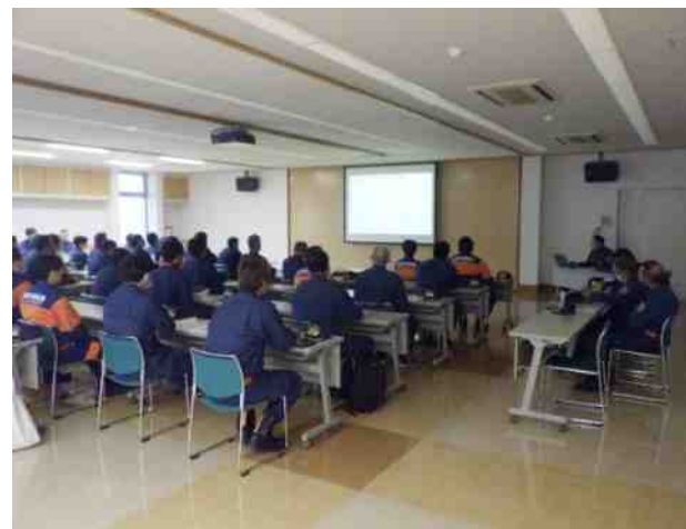
令和7年5月25日 新入団員研修