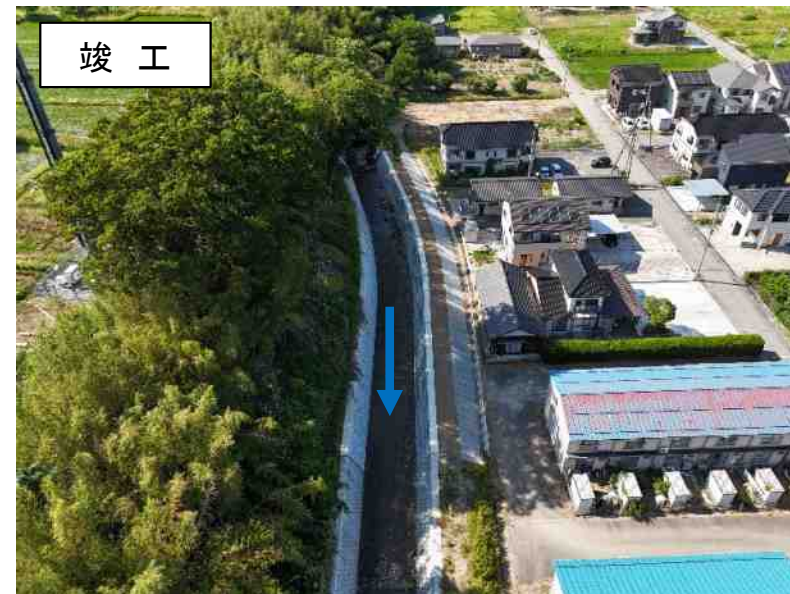
二級河川 中津川（佐渡市千種地内）