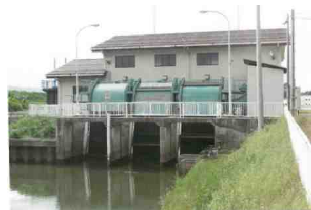
国仲排水機場（佐渡市）