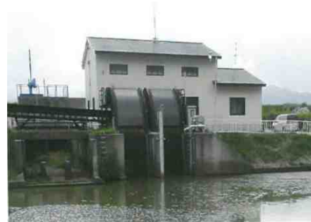
中興排水機場（佐渡市）