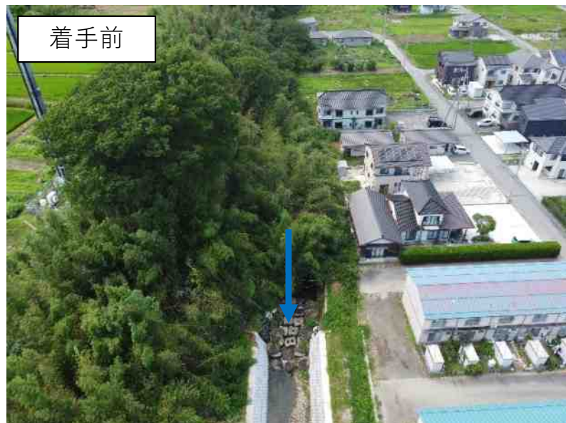
二級河川 中津川（佐渡市千種地内）