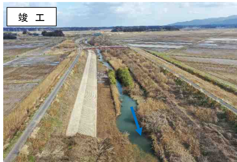
二級河川 河崎川（佐渡市川崎地内）