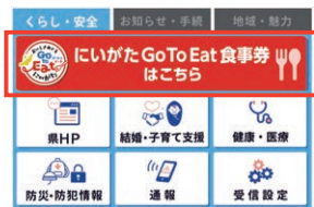
リニューアル後の画面

※初回登録アンケートで居住地を「県内」と回答した方のみ「 にいがたGoToEat食事券はこちら 」のバナーが表示されます。