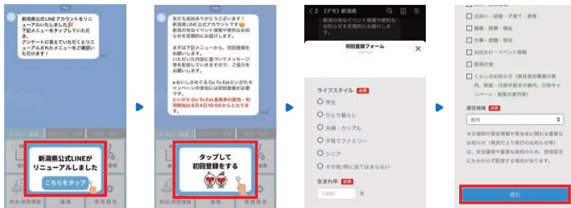
新規メッセージ画面

既に友だちの方には、新潟県LINE公式アカウントの画面に「新潟県公式LINEがリニューアルしました」が表示されます。下記のとおり、画面下部「新潟県公式LINEがリニューアルしました」をタップすると、「タップして初回登録をする」が表示されます。さらにタップして、初回登録をお願いします。