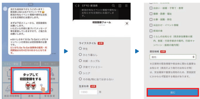
友だち追加後の画面

友だち追加完了後、新潟県LINE公式アカウントの画面に「タップして初回登録をする」が表示されます。下記のとおり、画面下部をタップして、初回登録をお願いします。