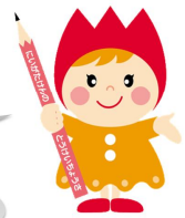
チュッピーちゃん 新潟県統計イメージキャラクター