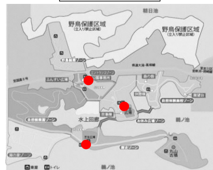
●: AED 設置位置