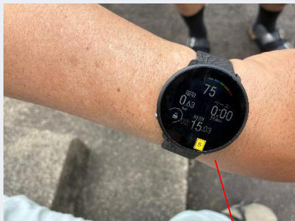
スマートウォッチ、胸部バンドにより心拍数等を連続測定