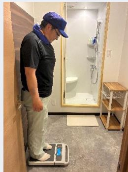
作業前後の体重測定