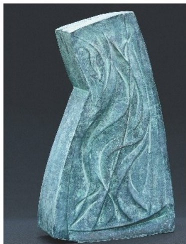
工芸 原 ノブ《波游蒼藻》