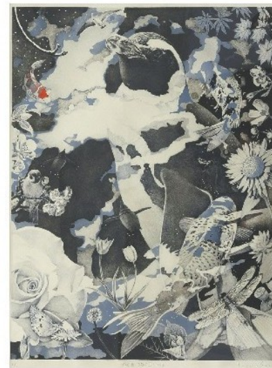
版画 坂井敏雄《めぐる、つなぐII》