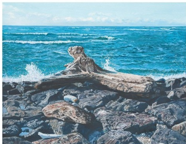
洋画 星野英雄《流木》