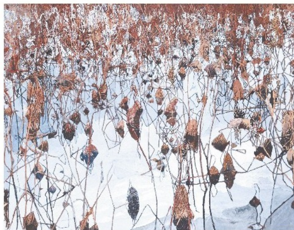
日本画 池田幸一《冬近し蓮堀園》