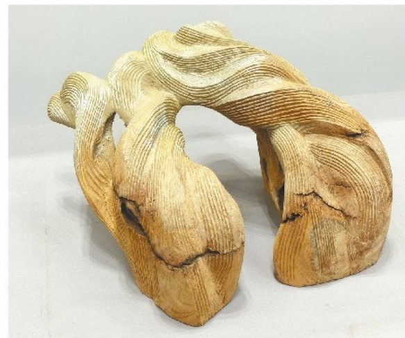
彫刻 手塚千晴《稲穂に風》