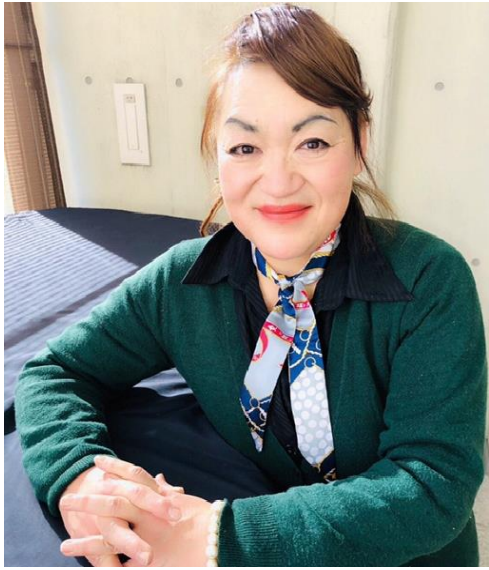
プロフィール写真