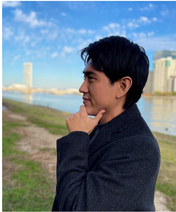
プロフィール写真