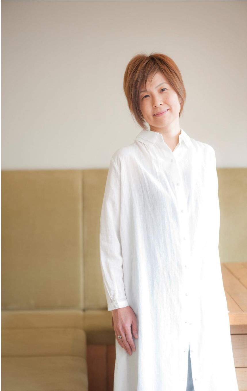
プロフィール写真