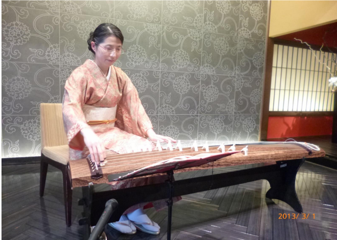
プロフィール写真