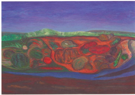
13 田辺和栄 「双構」 2014年自由美術展 21