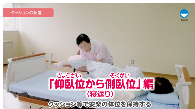
在宅介護に必要な基本介護技術「仰臥位から側臥位」編