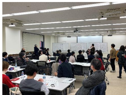
(参考：R5「4大学合同フォーラム」の様子)