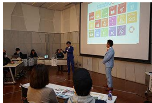
(参考：R5「阿賀野川エコミュージアムを目指す流域再生フォーラム」の様子)