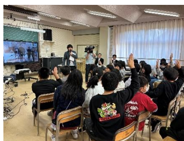
参考：笹岡小学校と水東小学校とのリモート交流（第 1 回目）の様様