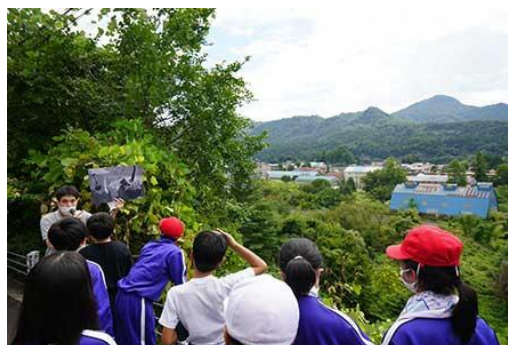
（R6「現地学習サポートパック」の様子）