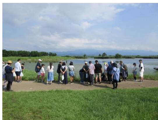
（R6「一日館長」事業の様子）