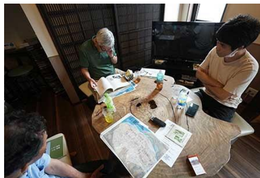
（R6「ロバダン！（炉端談義）」の様子）