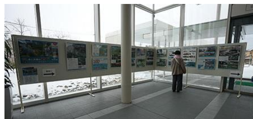
(参考：R5「パネル巡回展」の様子)