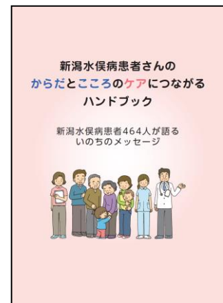
(ハンドブック表紙)