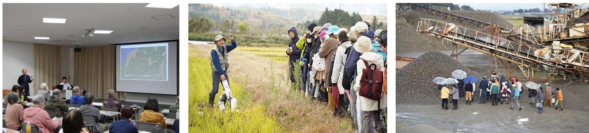
（R6阿賀流域再発見・連続ツアー講座の様子）