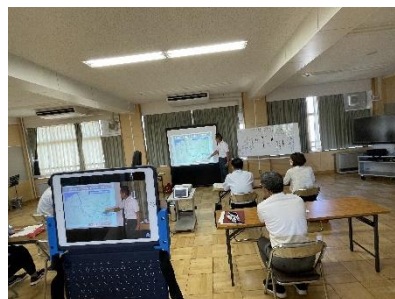
（R5「新潟水俣病学習サポーター」による活動の様子）