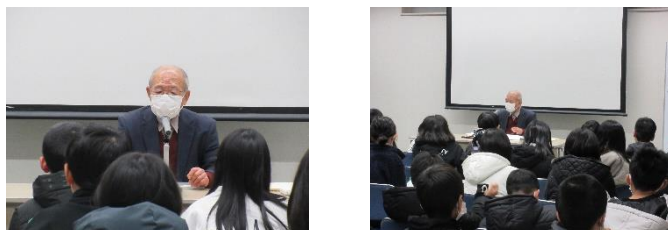
（R6「語り部口演会」の様子）