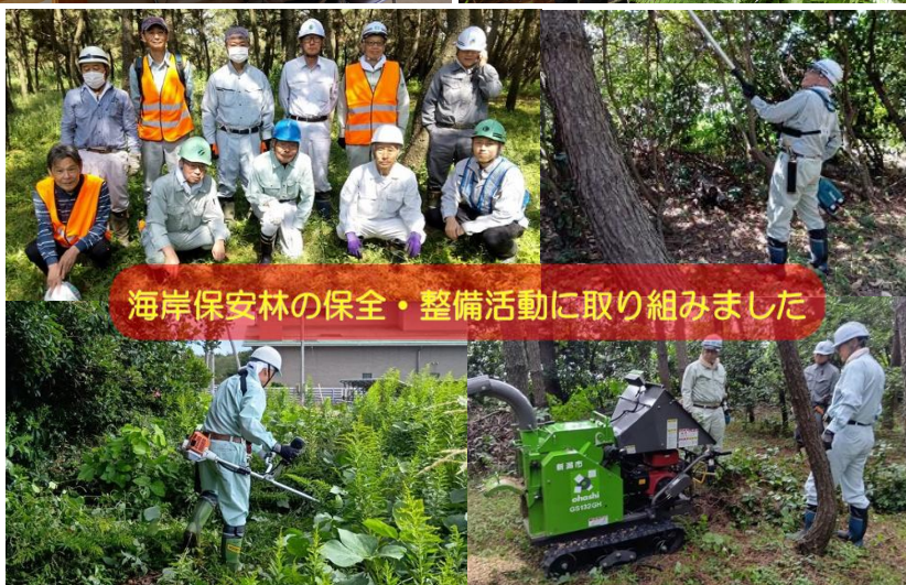
海岸保安林の保全・整備活動に取り組みました