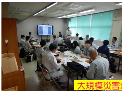
大規模災害対応総合演習

5月23日(金)に津川地域振興局で開催された「大規模災害対応総合演習」に、当センターから7名が参加し、山地災害危険地区や治山施設点検の研修を行いました。