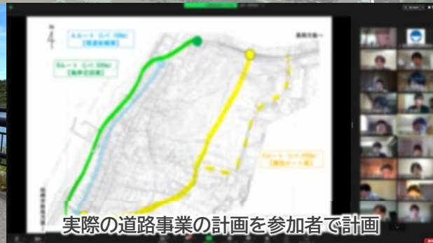
実際の道路事業の計画を参加者で計画