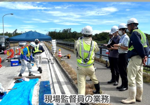
現場監督員の業務