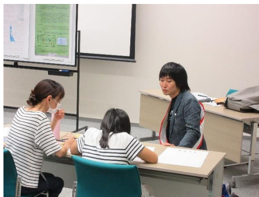
(R5「一日館長」事業の様子)