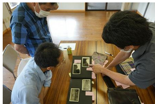
（R5「ロバダン！（炉端談義）」の様子）