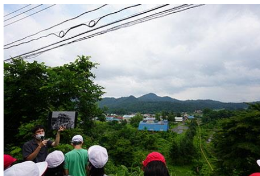
（R5「現地学習サポートパック」の様子）