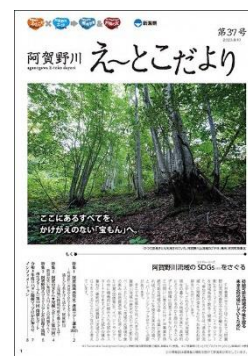
(え～とこだより第 37 号)