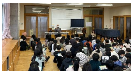
（R5 「語り部口演会」の様子）