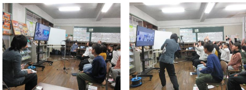
参考：岡方第一小学校と久木野小学校とのリモート交流（第 1 回目）の様