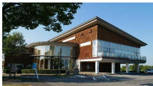
(県立環境と人間のふれあい館)