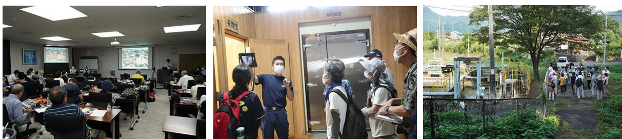
（R5阿賀流域再発見・連続ツアー講座の様子）