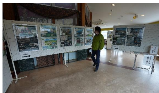
(参考：R4「パネル巡回展」の様子)