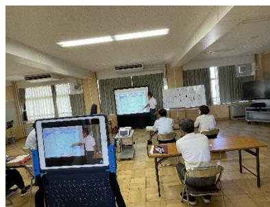
（R5「新潟水俣病学習サポーター」による活動の様子）