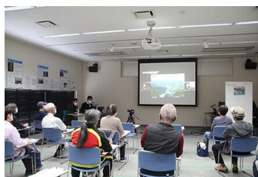
(参考：R4「阿賀野川エコミュージアムを目指す流域再生フォーラム」の様子)