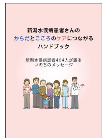
(ハンドブック表紙)