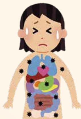
アルツハイマー病