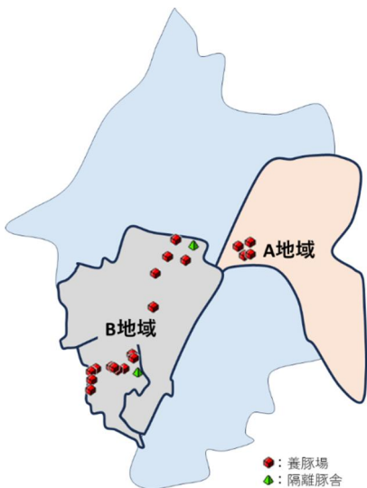
図1 A、B地域における養豚場の分布

豚繁殖・呼吸障害症候群（PRRS）の安定化・清浄化には、個々の農場対策に加え、地域全体で侵入防止や封じ込めに取り組むことが重要である。管内は小中規模養豚場が密集しており（図1）、豚や飼料、資材等の物流面でも相互に密接な関係を持っており、PRRSをはじめとする疾病に地域一体となって対策を講じる意識が醸成されやすく、関係機関が一丸となって防疫対策を推進してきた[1, 2, 3, 4]。本年度、肥育農場一つを除き清浄化を達成したところであり、今回は令和7年度に清浄化を達成したA地域、及びPRRS陰性を長期間維持しているB地域の2地域の取組について報告する。