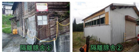
図 3 隔離豚舎

の隔離施設設置や隔離豚舎②の利用によって、現在は対応している。PRRS 検査は ELISA によって実施、隔離豚舎での外部導入検査は現在年間に延べ 8 回程度であり、当初は導入時と隔離期間 2 週間後の 2 回検査を AD とともに実施していたが、現在は陰性農場からの導入と、隔離期間後の PRRS 検査 1 回のみで対応している。