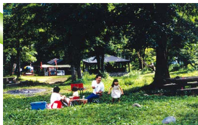
自然とふれあえる場所を提供する ていきょう