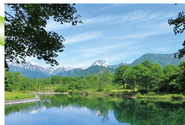
空気をきれいにする