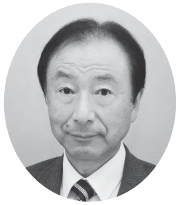
新潟県スポーツ推進 委員協議会会長