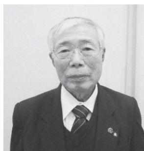
新潟市スポーツ推進委員

この度、第66回全国スポーツ推進委員研究協議会会長野大会で文部科学大臣表彰を受賞させていただきました誠にありがとうございました。私を支えていただいた関係各位に感謝申し上げます。 私は参加者にスポーツやゲームを楽しんでもらうためのヒントをいつも考えています。それは、参加者が「面白そう」と興味を持つことで、ルールを守り、楽しんで、いい汗をかいて「楽しかった！また参加したい！」と思ってもらえる好循環が生まれるはずだからです。嫌々体を動かしても怪我の元です。心と体の健康の為に楽しく体を動かしましょう！これからも市民の健康のために頑張ります。