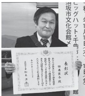
三条市スポーツ推進委員