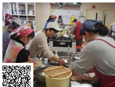
味噌づくり体験の様子