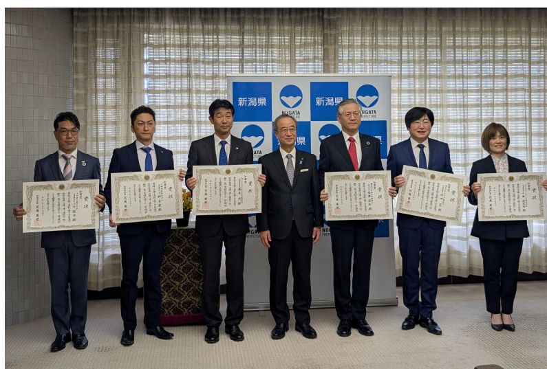
知事表彰式（記念撮影）の様子