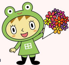
新潟県農地部 公式キャラクター 「棚田みらいちゃん」