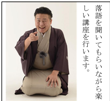
毘八家五円 (きはちや ごえん)