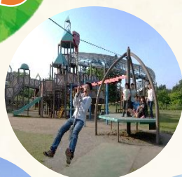
大型遊具で遊べる