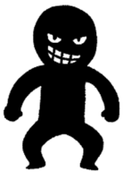
犯人 (社長になりすまし)

急遽、支払いが必要になった。 今日中に振り込むように。 振込完了後、振込明細の画像も送ること