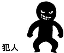
犯人 (社長になりすまし)

プロジェクトのため、新しい SNS グループを作成し、その二次元コードを送信すること。 会社の口座情報や利用残高も教えて欲しい。