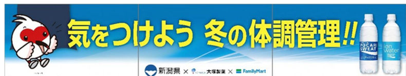
店頭サイネージのイメージ