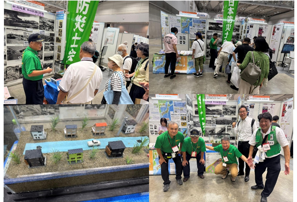
最新鋭の自動液状化実験装置!!