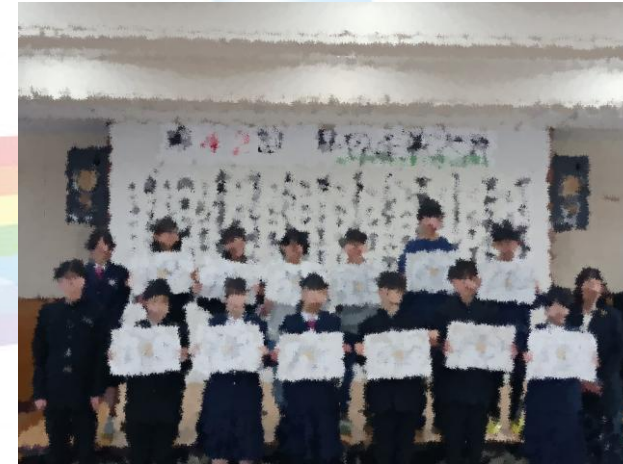
私の主張大会の様子