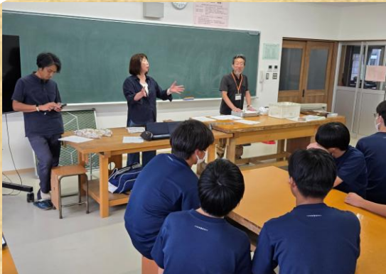
中学生の「やりたいこ