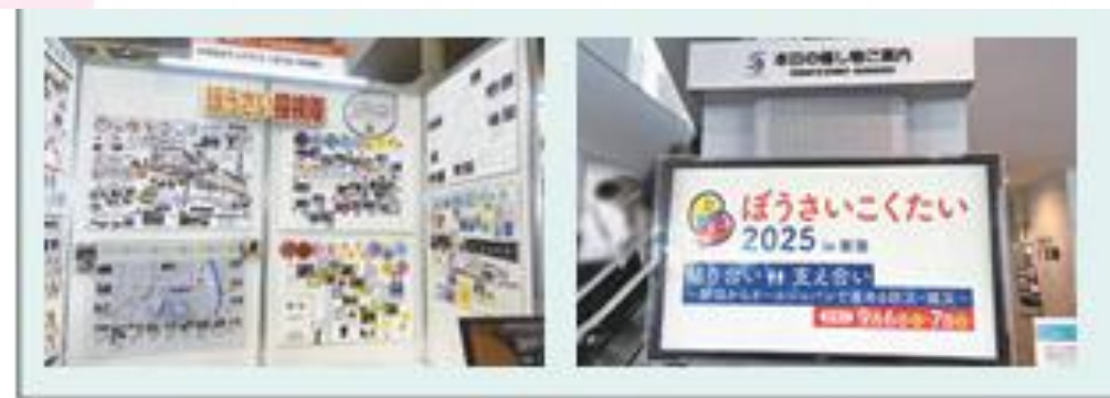
「ぼうさいこくたい2025」にて展示