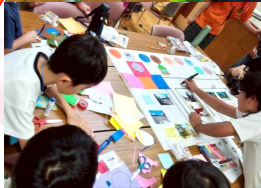
【協力してマップ作成】