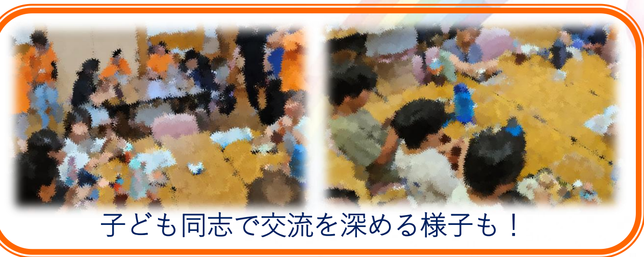
子ども同志で交流を深める様子も！