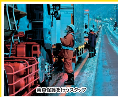
令和7年3月 山梨県内国道20号における 車両滞留の発生状況