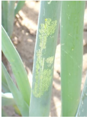
図3 シロイチモジヨトウの食害