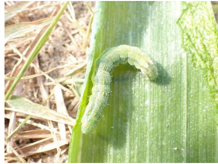
図4 シロイチモジヨトウの中齢幼虫