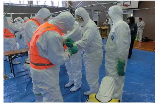
鳥インフルエンザ防疫訓練の様子

また、村上地域振興局管内はニワトリや豚など家畜の飼養数が多いことから、これら家畜に伝染病が発生した時の防疫体制を強化するため、平時から関係機関と連携し、防疫訓練や情報共有を行っています。