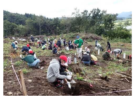
＜地域での緑化活動支援＞