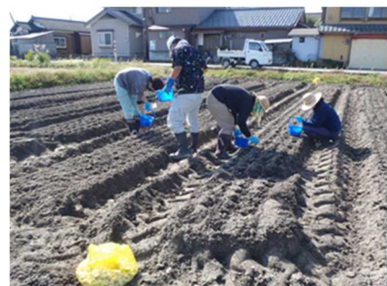
<農福連携の作業風景>