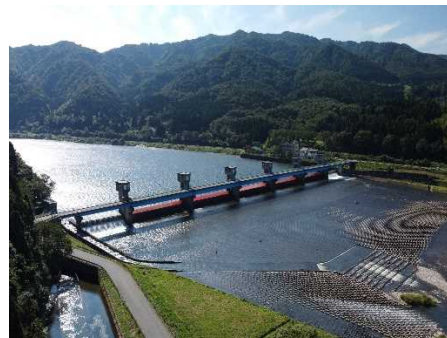
【荒川 願首工(百選選定)】