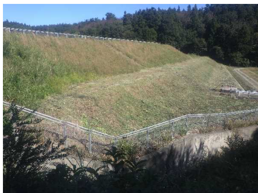
【ため池耐震工事前】

近年頻発する局地的豪雨や地震などによる災害のリスクに備え、湛水、地すべり、ため池決壊などの被害を未然に防止するための対策工事を実施しています。