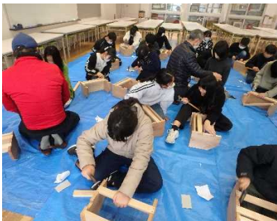
＜小学校での森林・林業教育＞

小中学校での森林・林業に関する理解を深めるための授業、地域の団体等が実施する森林の保全管理や森林資源の活用等、森林の多面的機能の維持増進及び山村の活性化活動を支援しています。【林業振興課】