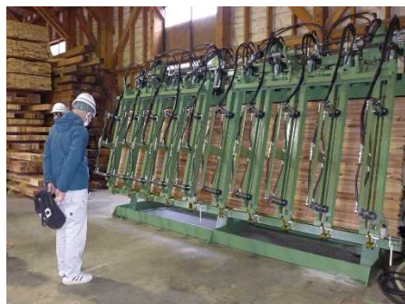
＜集成材プレス機械＞