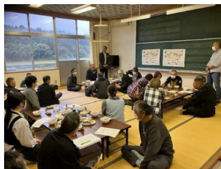
<集落での話し合い>