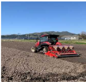
【水稻直播栽培の導入】