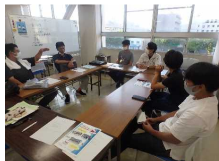
<若手農業者組織の定例会>