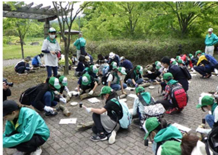
＜緑の少年団活動支援＞