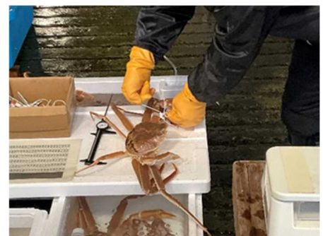
＜ブランド「越後本ズワイ」の出荷作業＞