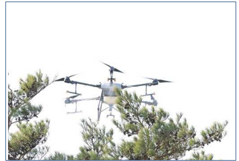
＜ドローンによる松くい虫防除＞

松くい虫等の森林病虫害被害から森林を守るため、空中散布による防除などを支援しています。【林業振興課】