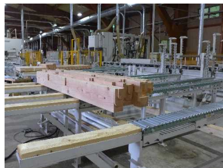
＜プレカット加工機＞