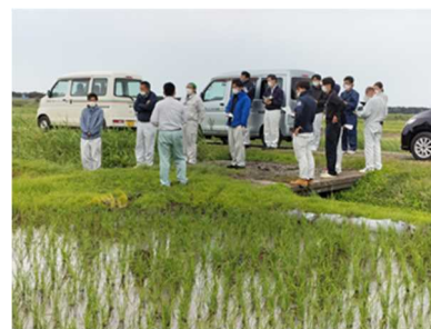
<岩船米現地検討会>