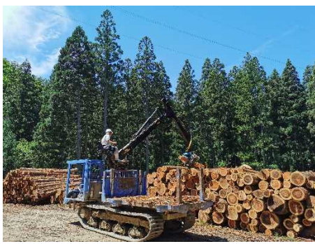
＜伐採木の集積作業＞