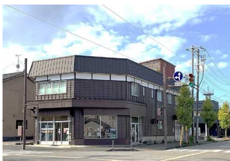
＜県産材による商店の外壁修繕＞

県産材の需要拡大を図るため、住宅や公共の施設での利用を支援するほか、バイオマスなど木材のフル活用の利用を推進しています。【林業振興課】