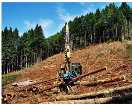
＜高性能林業機械による伐木作業＞

県内の県産材生産量の約4割を占める村上周管内における木材の安定供給に向け、林内路網の整備・適正配置、経営計画の策定による計画的生産支援や、機械化、効率的作業システムによる低コスト化のほか、それらを担う人材の育成を支援しています。【林業振興課・森林施設課】