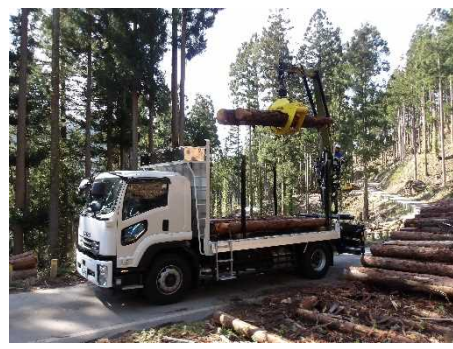
＜林道を利用した木材搬出＞