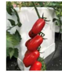
【育苗ハウスを活用したミニトマト栽培】