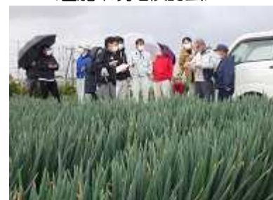
<園芸で儲ける研修会>

県の園芸振興基本戦略に基づき、「やわ肌ねぎ」や「ユリ切り花」の産地拡大や稲作法人等が所有する水稻育苗ハウスを活用した園芸導入を支援しています。「園芸で儲ける研修会」を開催し、栽培技術の向上を進めるとともに、新規に園芸を導入した経営体には重点的に個別指導を行っています。【普及課】