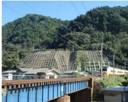
＜集落を守る法砕工＞