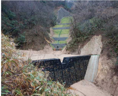
＜山地荒廃を防ぐ治山ダム＞

保安林における山地災害の防止を図るための治山施設の設置のほか、森林整備により、被災からの早期復旧に努めています。【森林施設課】