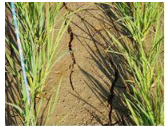
【中干しの程度は小ヒビが入る状態】