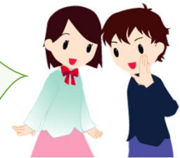
参加者の声（アンケートより）